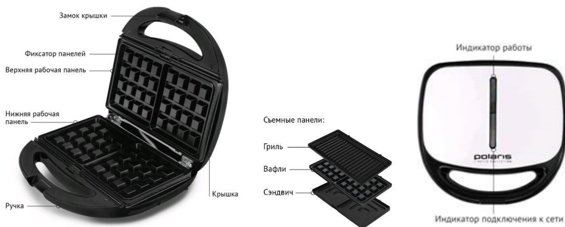
1-суретте берілген құрылғының сипаттамасы

Сэндвич пісіруге арналған құрылғы – бұл әртүрлі тағамдық өнімдерді құрылғының қыздырғыш панелінде немесе оның екі қыздырғыш панельдерінің аралығында қыздырып пісіру үшін арналған немесе қуыру жолымен әзірлеп, дайындауға арналған құрылғы.