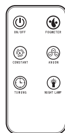
Прибор поставляется с пультом управления.