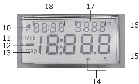
Рис. 3 Дисплей