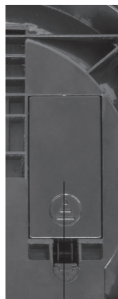
Рис. 2 Вид с обратной стороны