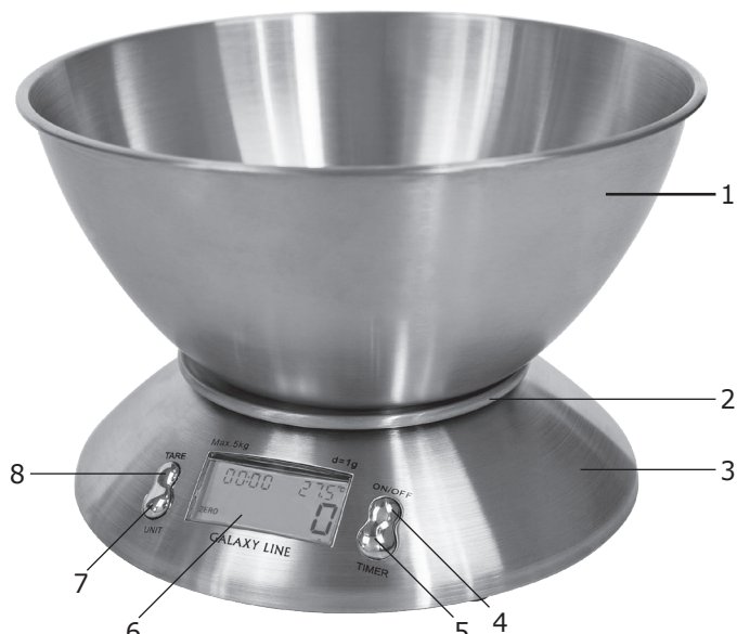
Рис. 1 Общий вид