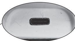
Разъем подключения шнура для зарядки