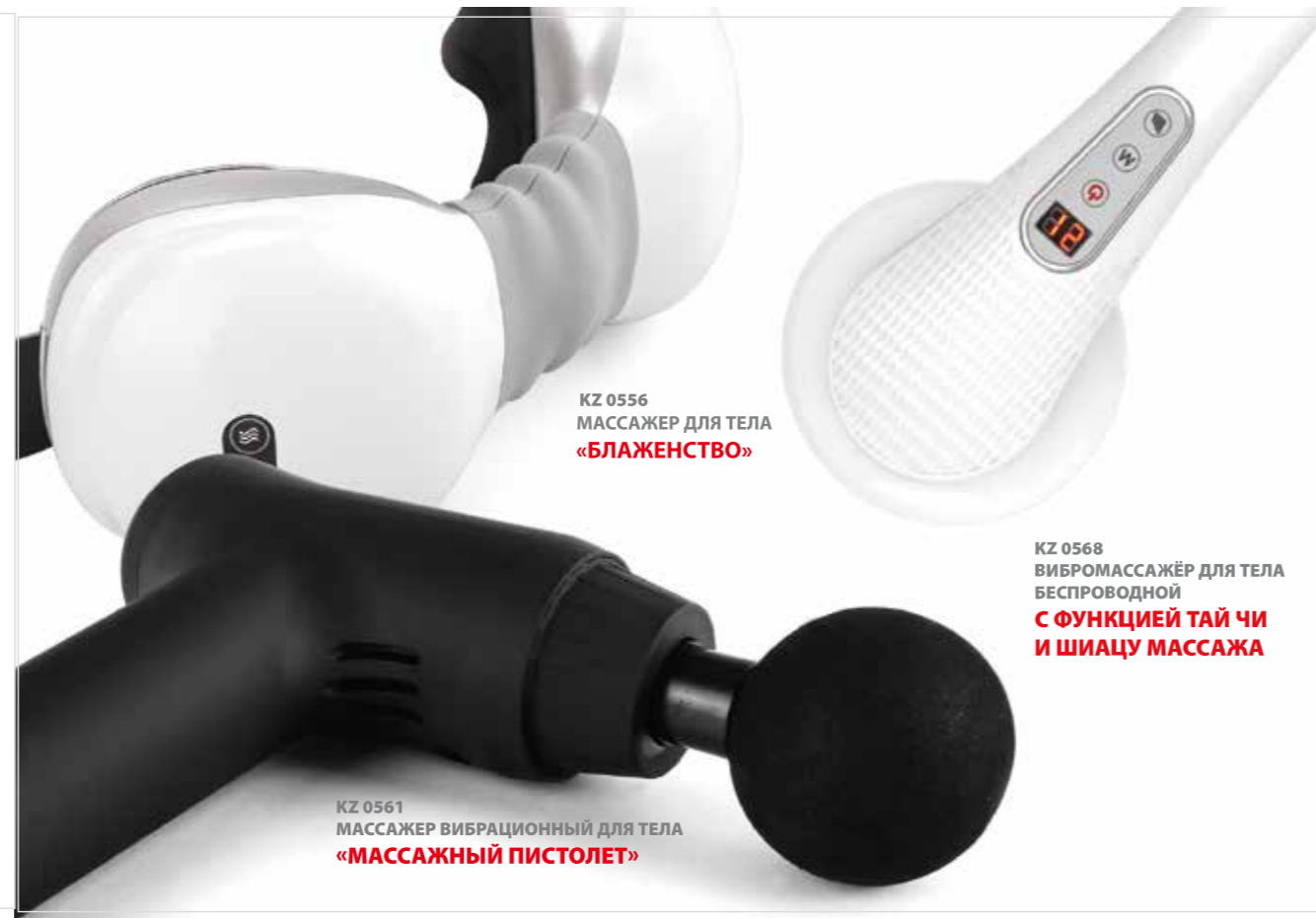
KZ 0556 МАССАЖЕР ДЛЯ ТЕЛА «БЛАЖЕНСТВО»