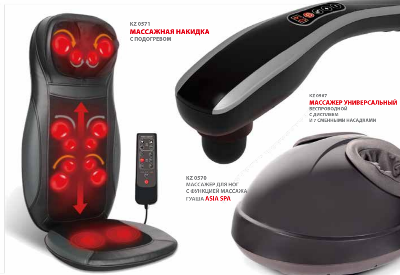
KZ 0571 МАССАЖНАЯ НАКИДКА С ПОДОГРЕВОМ