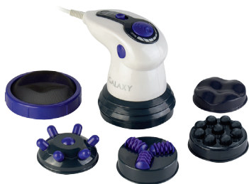
GL4942 МАССАЖЕР ДЛЯ ТЕЛА ЭЛЕКТРИЧЕСКИЙ