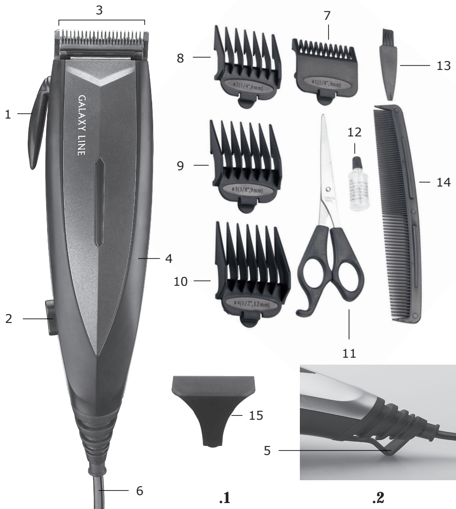
Элементы электроприбора (Рис. 1 и 2):