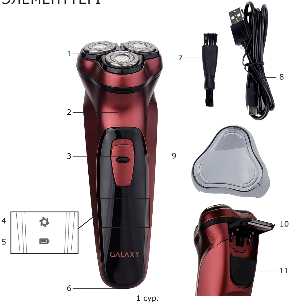
1 сур. Электр құралының элементтері (1 сур.)