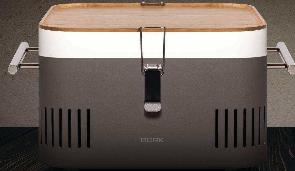
ГРИЛЬ УГОЛЬНЫЙ ПОРТАТИВНЫЙ G503 РУКОВОДСТВО ПОЛЬЗОВАТЕЛЯ