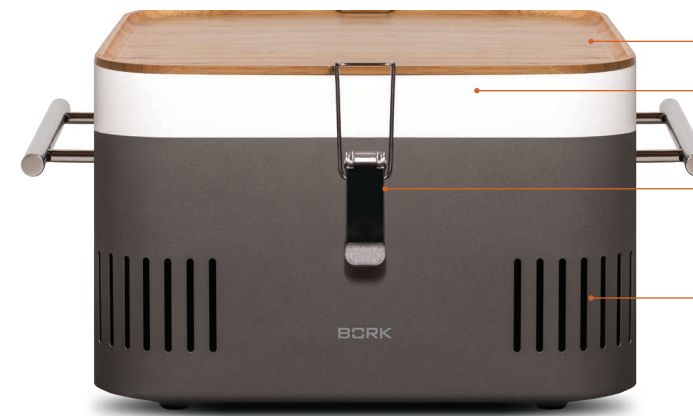
Сервировочная доска из бамбука