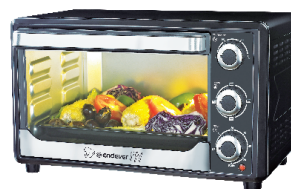
МИНИ-ПЕЧЬ DANKO - 4025