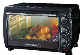
МИНИ-ПЕЧЬ DANKO - 4020