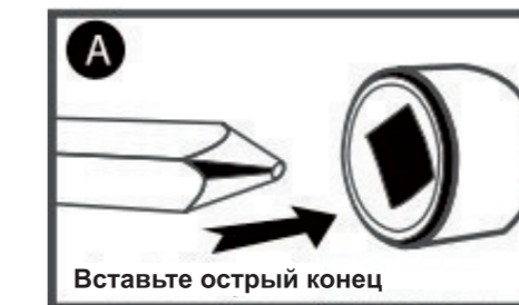
Вставьте острый конец