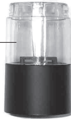
Стакан для специй