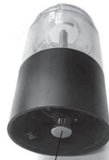
Винт для регулировки степени помола