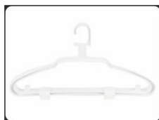
Вешалка с 2 зажимами