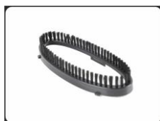
Насадка-щетка для отпаривания одежды, полотенец, постельного белья