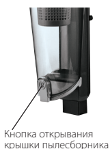
Кнопка открывания крышки пылесборника

Вы можете опорожнять пылесборник во время уборки, не снимая его с пылесоса.